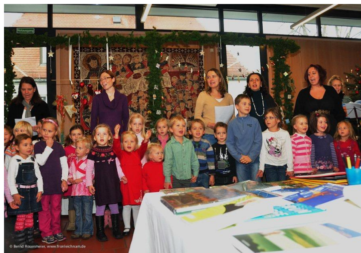
Weihnachtsmarkt 2011: Die Kinder und die Elternmusik des Kindergartens eröffnen den Weihnachtsmarkt

Außerdem gehen wir regelmäßig mit den Kindern in die Kirche, beispielsweise zu Aschermittwoch oder in der Adventszeit und bringen uns zu verschiedenen Gelegenheiten ins „Pfarreileben“ ein.