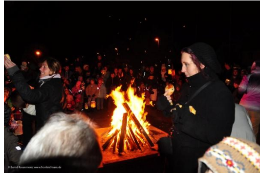
St. Martinsfeier 2011: Die Elternmusik des Kindergarten singt in der Kirche; die Mitarbeiter des Kindergartens verteilen selbstgebackene Martinsbrötchen am Feuer

Außerdem gehen wir regelmäßig mit den Kindern in die Kirche, beispielsweise zu Aschermittwoch oder in der Adventszeit und bringen uns zu verschiedenen Gelegenheiten ins „Pfarreileben“ ein.