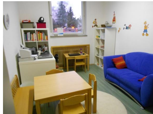
Lernwerkstatt „Werken“ und „Lese- und Schreibwerkstatt“