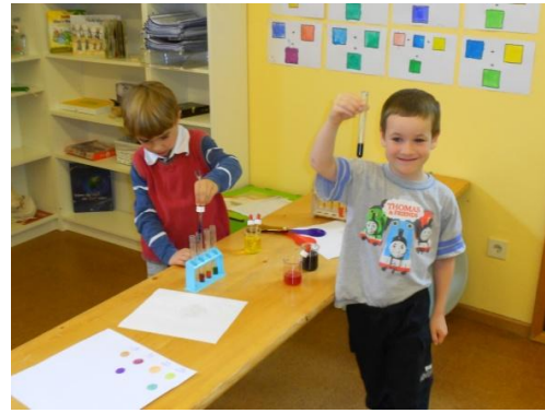
Experimentieren mit Farben und Elektrizität

Mit unseren Vorschulkindern machen wir ganzjährig das Projekt „Ein Königreich für die Zukunft“. Inhalte sind: