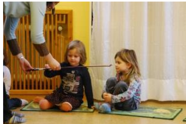
sich selbst ausprobieren – musikalische Früherziehung